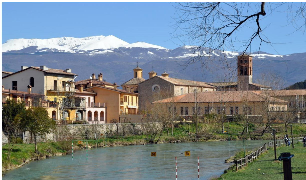
Fig.2 La città a due passi dal fiume con il monte Terminillo sullo sfondo.

L'Associazione è in grado di far scendere contemporaneamente fino a di 30 ragazzi per discesa, partendo da un minimo di 15. Ciò non preclude la possibilità di organizzare più discese in un giorno alternando il rafting con altre attività all'aperto o perché no una visita alla città.