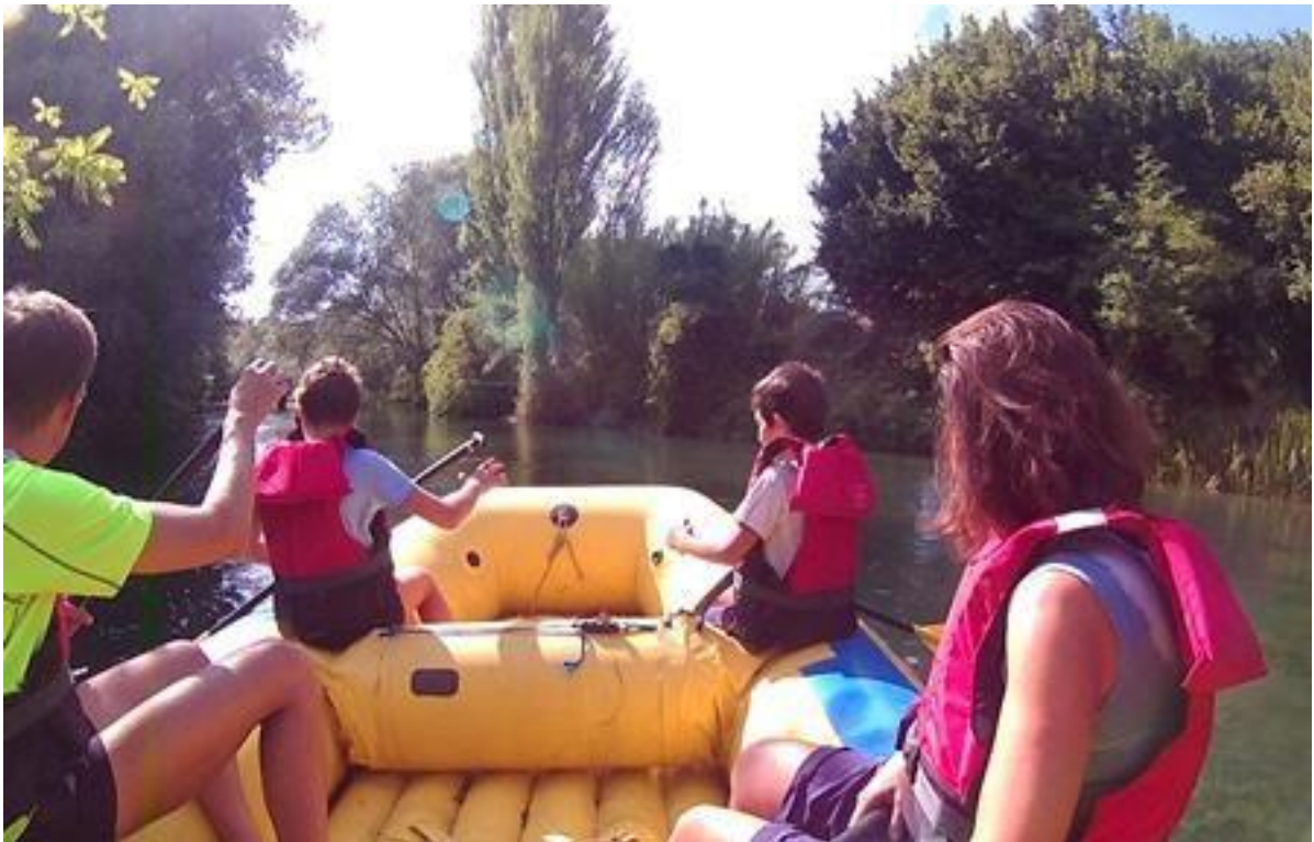
Fig.1 Escursione in raft

La ASD Roma Acquavventura, in collaborazione con altre associazioni del territorio è lieta di proporre all'interno del Reatino escursioni in raft , orientamento in montagna, in città e attività guidate alle pendici del monte Terminillo con l'obiettivo di far conoscere ai ragazzi l'entroterra laziale. Attraverso l'utilizzo del raft, mezzo a impatto zero e a conduzione umana i ragazzi e gli insegnanti potranno visitare il fiume, addentrarsi nel sottobosco fluviale e scovare i piccoli e grandi animali che abitano il territorio.